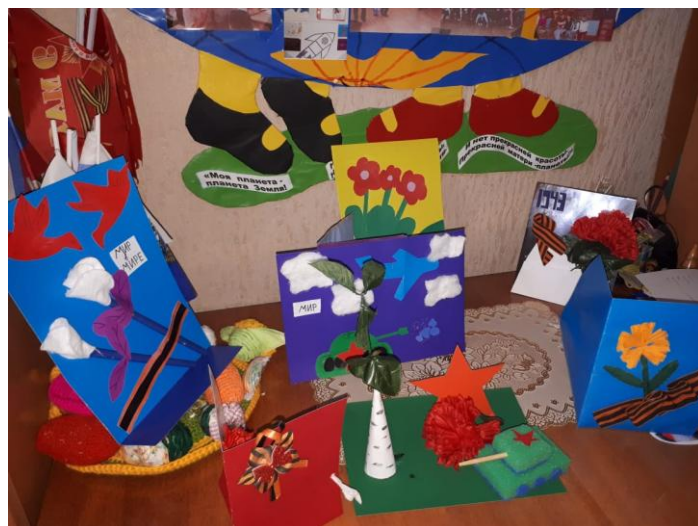
начальная школа х. Смычка