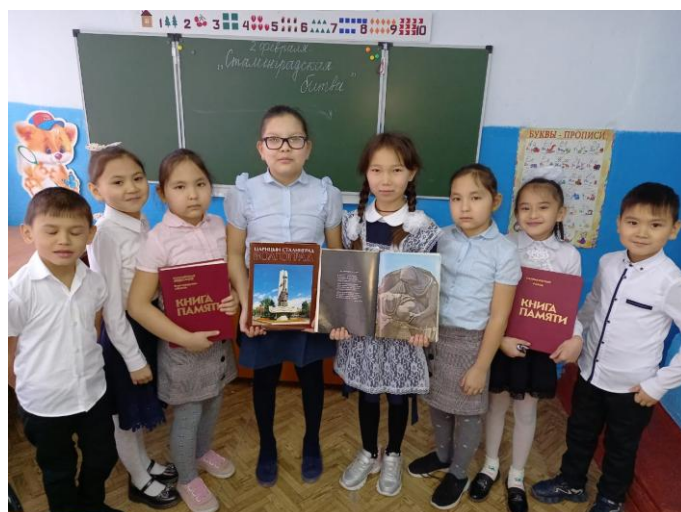
Начальная школа х. Кумыска