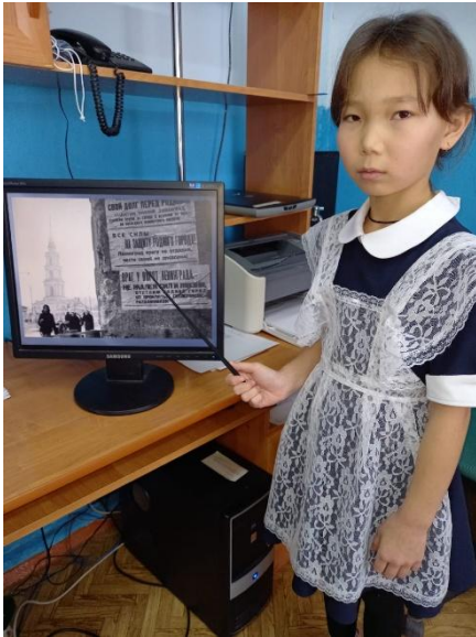
начальная школа х. Кумыска