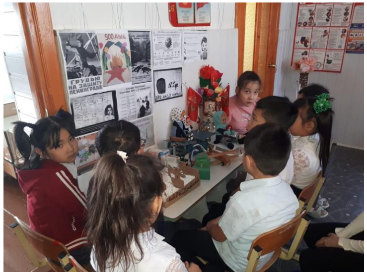
начальная школа х. Смычка